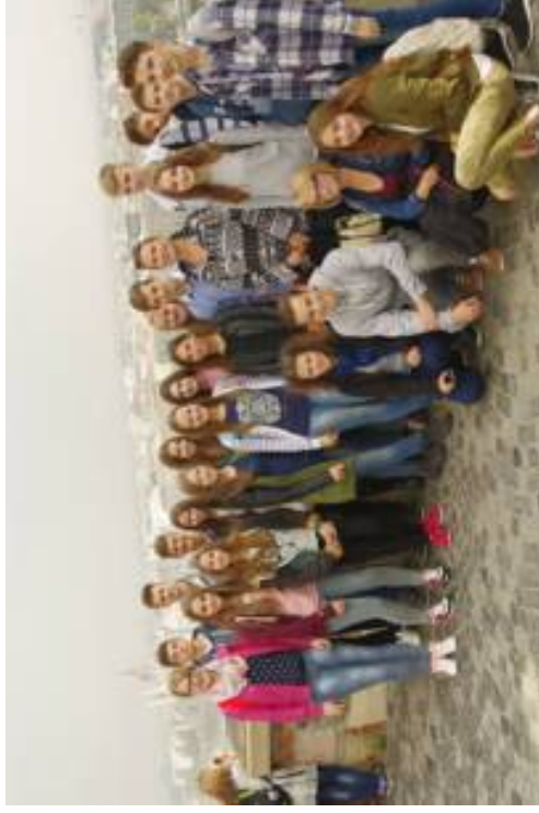
Fyzikálno-biologická exkurzia v Budapešti Zážitkové vyučovanie fyziky a biológie v rámci exkurzie našich žiakov do Budapešti prebiehalo v Paláci zázrakov formou interaktívnych experimentov. V rámci biológie navštívili Tropikárium a oceánárium, kde mali možnosť sledovať žraloky, aligátory či hady. Súčasťou exkurzie bola aj prehliadka Budapešti (Hradný vrch, Panätník slobody atď.).