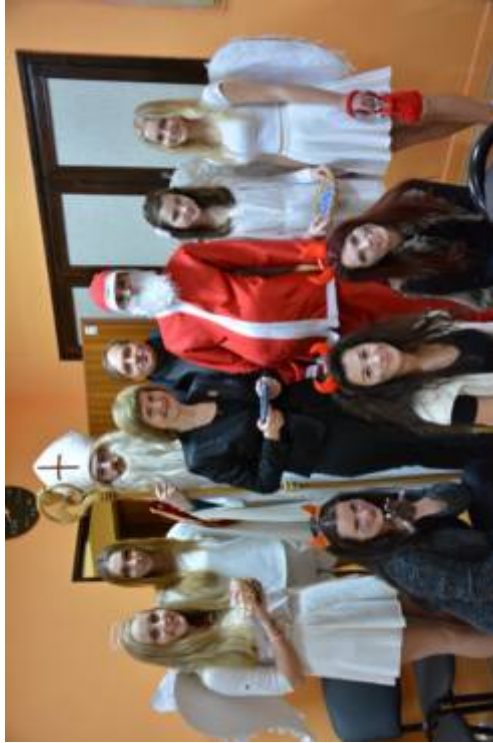
Mikuláš na GUAR

Neodmysliteľnou súčasťou zábavných aktivít Žiackej školskej rady na GUAR je aj návšteva Mikuláša. V príjemnej atmosfére, ktorú Mikuláš spolu s anjelmi a čertom vytvorí, sa v tento deň ľahšie učí.