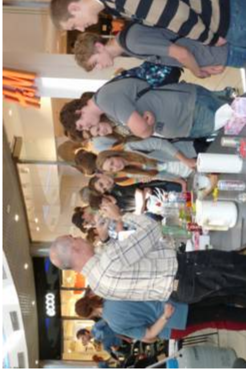
Festival vedy – Európska noc výskumníkov, Košice Festival vedy – Európska noc výskumníkov je projekt podporovaný Európskou komisiou. Naša pravidelná návšteva na tomto festivale dopĺňa dôkladne prepracované učebné plány s dôrazom na experimentálne a vedecké vyučovanie prírodovedných predmetov, na využívanie IKT na vyučovaní, rozvíjanie prezentačných zručností a sociálnych kompetencií.