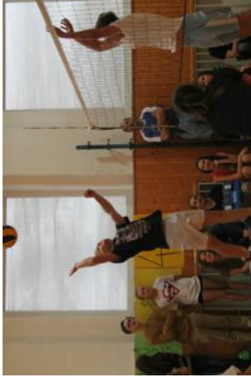
Medzitriedny vianočný volejbalový turnaj

Každoročne v mesiacoch november a december prebieha na GUAR medzitriedny volejbalový turnaj, ktorého vyvrcholenie v predvianočnom období sa tradične spája s vynikajúcimi výkonnými žiakov a výbornou atmosférou.