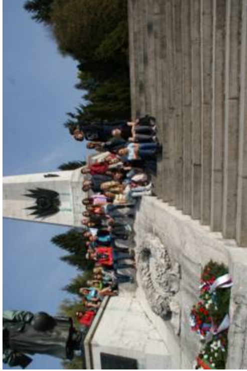
Dukla – Svidník

Exkurziou „Po stopách prvej a druhej svetovej vojny“ vo Svätý Jur a na Dukle si žiaci každoročne rozširujú a dopĺňajú vedomosti získané na hodinách dejepisu.